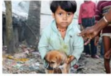
لا تأخذ الكلاب الضالة