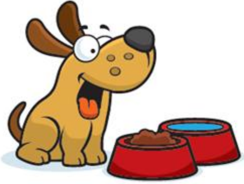
1-غذاء صحي ومياه نظيفة

تقع على عاتقك مسؤولية التأكد من أن حيوانك الأليف: