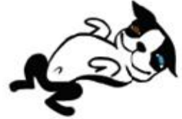
أنا كنزك (كشط معدني)