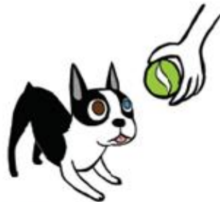
جاهز! (وضعية الانتقاض)