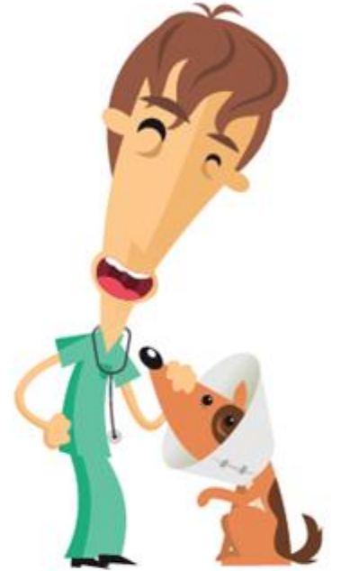
3-العناية إذا كان مريضا أو مصابا