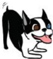
أنا ودود وضعية اللعب