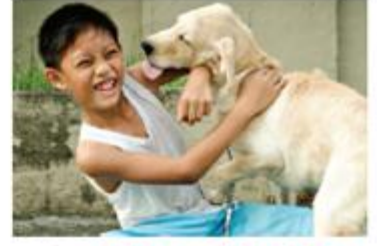
تجنب اللعق والخدش