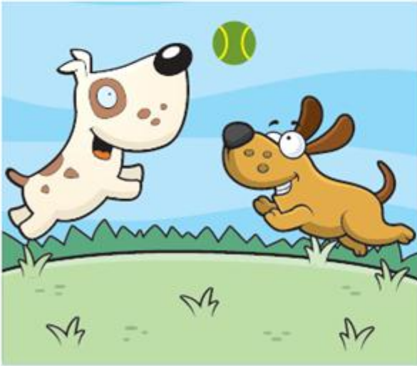
4-أصدقاء حيوانات اخرين سليمين للعب