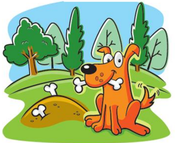
5-السعادة! لا يجب أن نخيف أو نزعج حيواناتنا