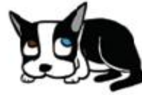
أحتاج إلى مساحة