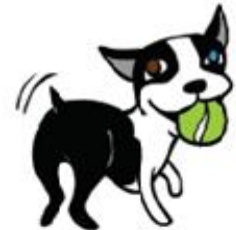
أنا مسرور (أنا احرك ذيلي)