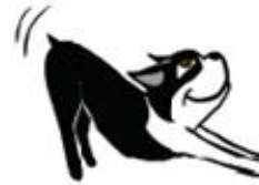
مرحبا أنا احبك (امتداد الترحيب)