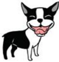
أنا سعيد (أو أشعر بالحر)