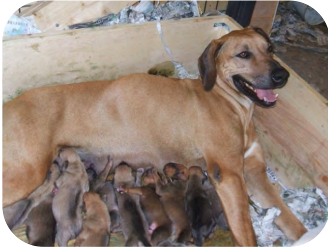
Заботится о щенятах